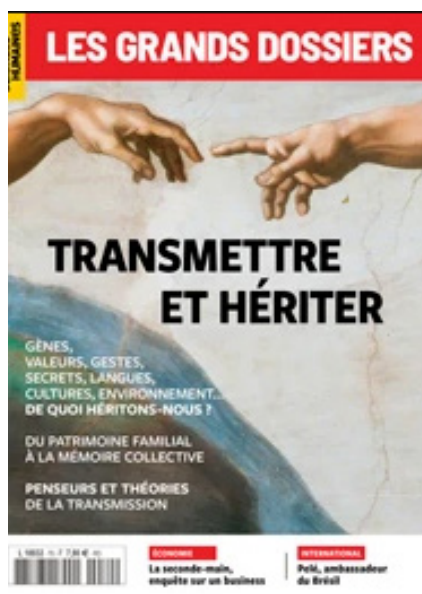
Sciences humaines - Grands dossiers n° 70 - mars - avril - mai 2023