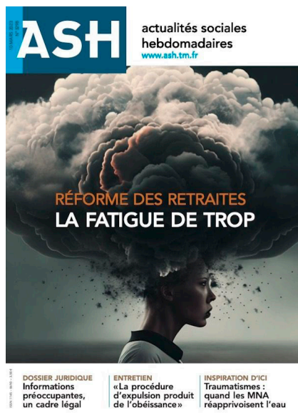
ASH N° 3298 - 10 Mars 2023