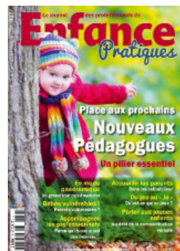
Journal des professionnels de l'enfance - N°137 (septembre - octobre - novembre 2023) Place aux prochains nouveaux pédagogues

https://www.em-consulte.com/revue/MELAEN/29/320/table-des-matieres/