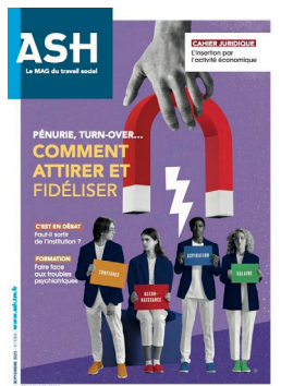
ASH N° 3308 (septembre 2023) Pénurie, turn-over Comment attirer et fidéliser