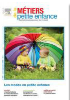
Métiers de la petite enfance N° 320 (septembre 2023) Les modes en petite enfance

https://www.ash.tm.fr/numeros-juridiques/3308/