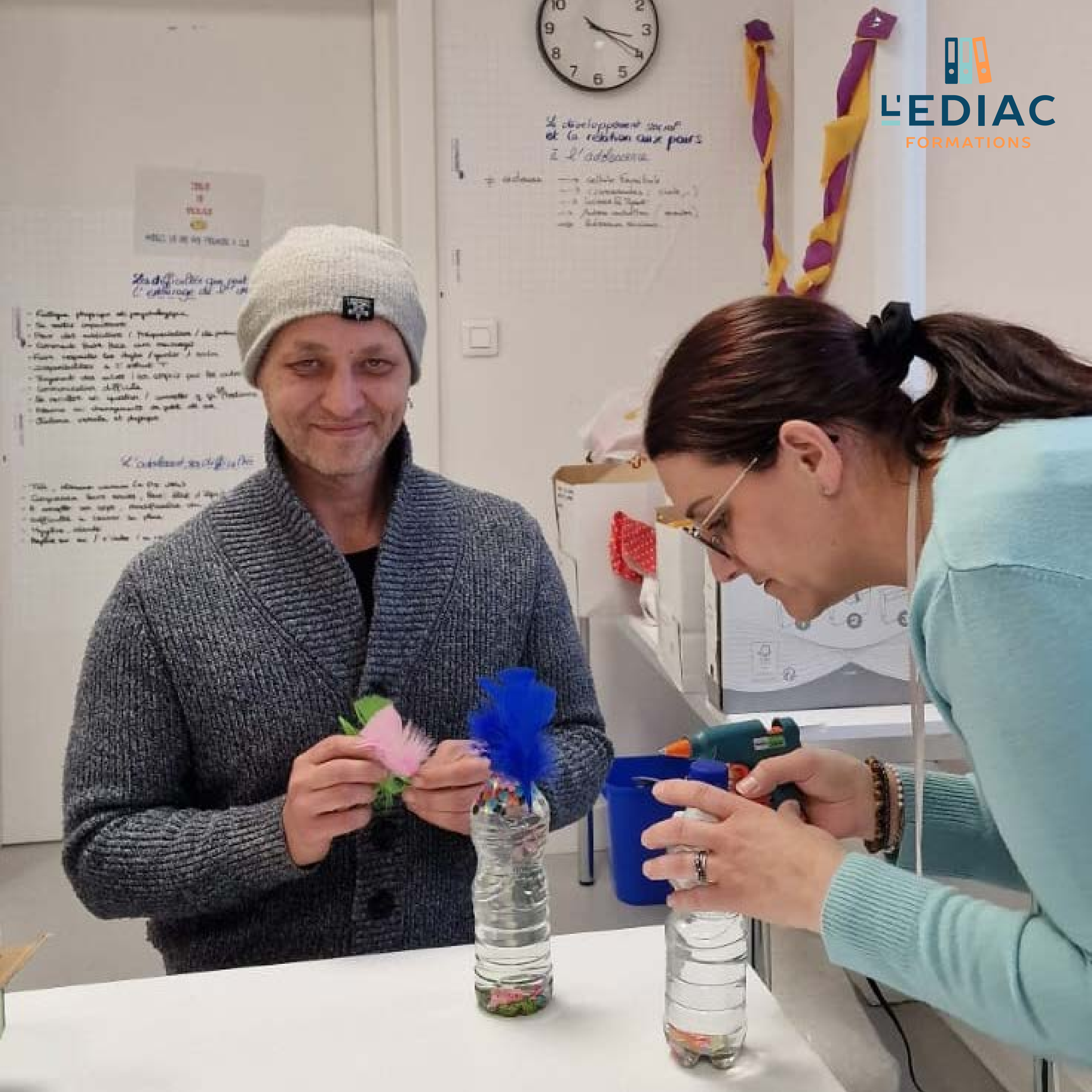
TABLE DES MATHS 2023 2023-24

Les difficultés que pose l'écriture de l'adulte