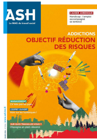
N° 3336 Mars 2026 Addictions - Objectif réduction des risques Sommaire