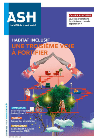
N° 3334 - Janvier 2026 Habitat inclusif : une troisième voie à fortifier Sommaire