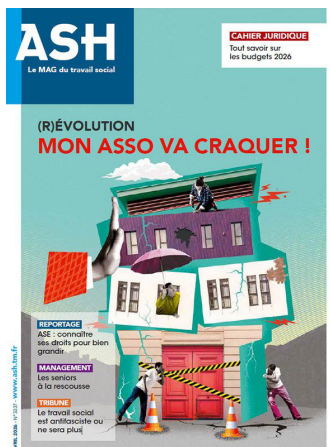
N° 3337 Avril 2026 (R)évolution : Mon asso va craquer !