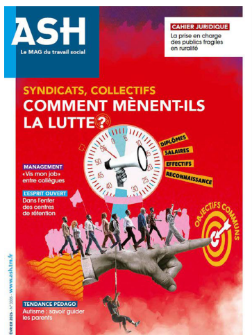
N° 3335 — Février 2026 Syndicats, collectifs - Comment mènent-ils la lutte ? Sommaire